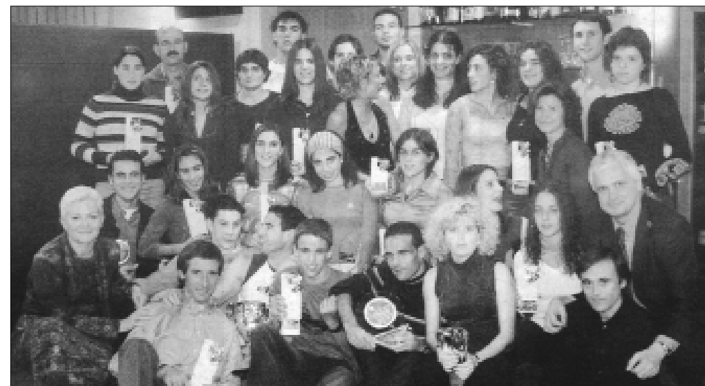
Un grup d'atletes premiats per les seves actuacions en el decurs de la temporada.