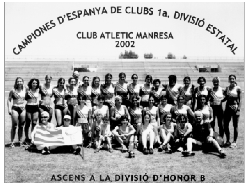
Lequip femení, campió d'Espanya de Primera Divisió, de la Lliga Nacional.